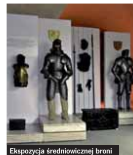
Ekspozycja średniowiecznej broni

mur obronny z Dolną i Górną Bramą. Od 1776 r. miejscowość jest siedzibą biskupstwa spiskiego.