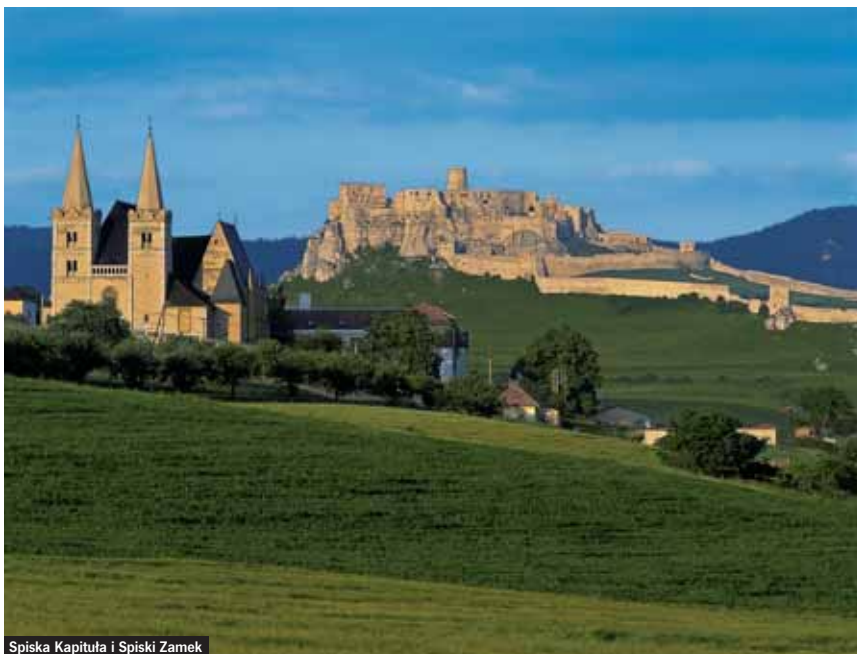
Spiska Kapitula i Spiski Zamek

Jednym z najcenniejszych zabytków Spiszu i narodową pamiętką kulturalną Słowacji jest Spiski Zamek – największy średniowieczny kompleks zamkowy w Europie Środkowej (o powierzchni 4 ha). Jego budowa rozpoczęła się prawdopodobnie już na początku XII w., a zamieszkały był aż do 1948 r. Jest usytuowany na wysokości 634 m n.p.m. na wapiennej skale, która wznosi się 200 m nad Kotliną Spiską. W 1961 r. uznano go za Narodowy Pomnik Kultury, a od 1993 r. znajduje się na Liście Światowego Dziedzictwa Kulturalnego i Przyrodniczego UNESCO.