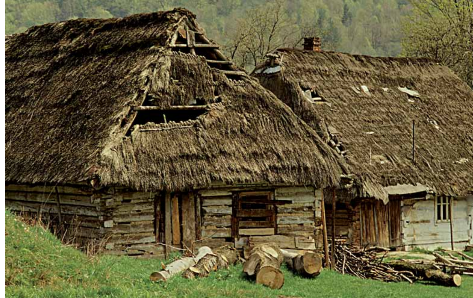
▲ Bartne – dom w ród gór...

Tragedia przesiedlenia, która dotknęła Łemków w latach 1944–1947, spowodowała, że łemkowskie wsie przestały istnieć. Na pewien czas znikł i standard łemkowski język, na drogach przestały jeździć drewniane wozy Łemków. Pierwsza fala przesiedlenia przyszła jeszcze przed akcją „Wisła”: w ramach umowy ze Związkiem Radzieckim o wymianie mieszkańców na Ukrainę przeniesiono się – dobrowolnie lub z nakazu – około 70 tys. mieszkańców Łemkowszczyzny. Dobrowolne wyjazdy skończyły się szybko, już w połowie 1945 r. Skoro Łemkowie przestali wyjeżdżać z własnej woli, zastosowano przymus. Wkrótce miał rozpocząć się drugi akt dramatu: wiosną 1947 r. ruszyła operacja wysiedlenia „Wisła”. Wysiedlenia przeprowadzone w ramach akcji „Wisła” boli do dziś. To jedna z ran, które zaleczy najtrudniej.