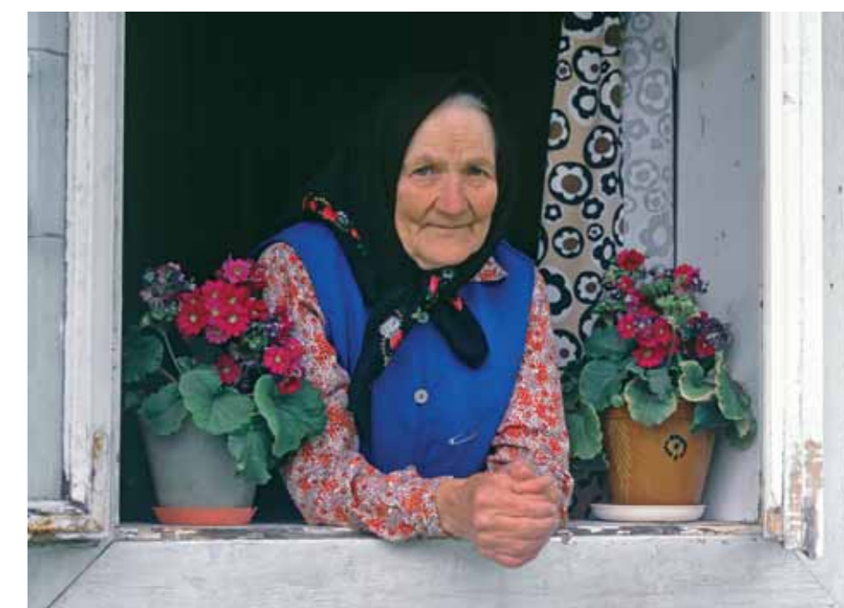
▼ Łemkini z Bartnego.

Tragedia przesiedlenia, która dotknęła Łemków w latach 1944–1947, spowodowała, że łemkowskie wsie przestały istnieć. Na pewien czas znikł i standard łemkowski język, na drogach przestały jeździć drewniane wozy Łemków. Pierwsza fala przesiedlenia przyszła jeszcze przed akcją „Wisła”: w ramach umowy ze Związkiem Radzieckim o wymianie mieszkańców na Ukrainę przeniesiono się – dobrowolnie lub z nakazu – około 70 tys. mieszkańców Łemkowszczyzny. Dobrowolne wyjazdy skończyły się szybko, już w połowie 1945 r. Skoro Łemkowie przestali wyjeżdżać z własnej woli, zastosowano przymus. Wkrótce miał rozpocząć się drugi akt dramatu: wiosną 1947 r. ruszyła operacja wysiedlenia „Wisła”. Wysiedlenia przeprowadzone w ramach akcji „Wisła” boli do dziś. To jedna z ran, które zaleczy najtrudniej.