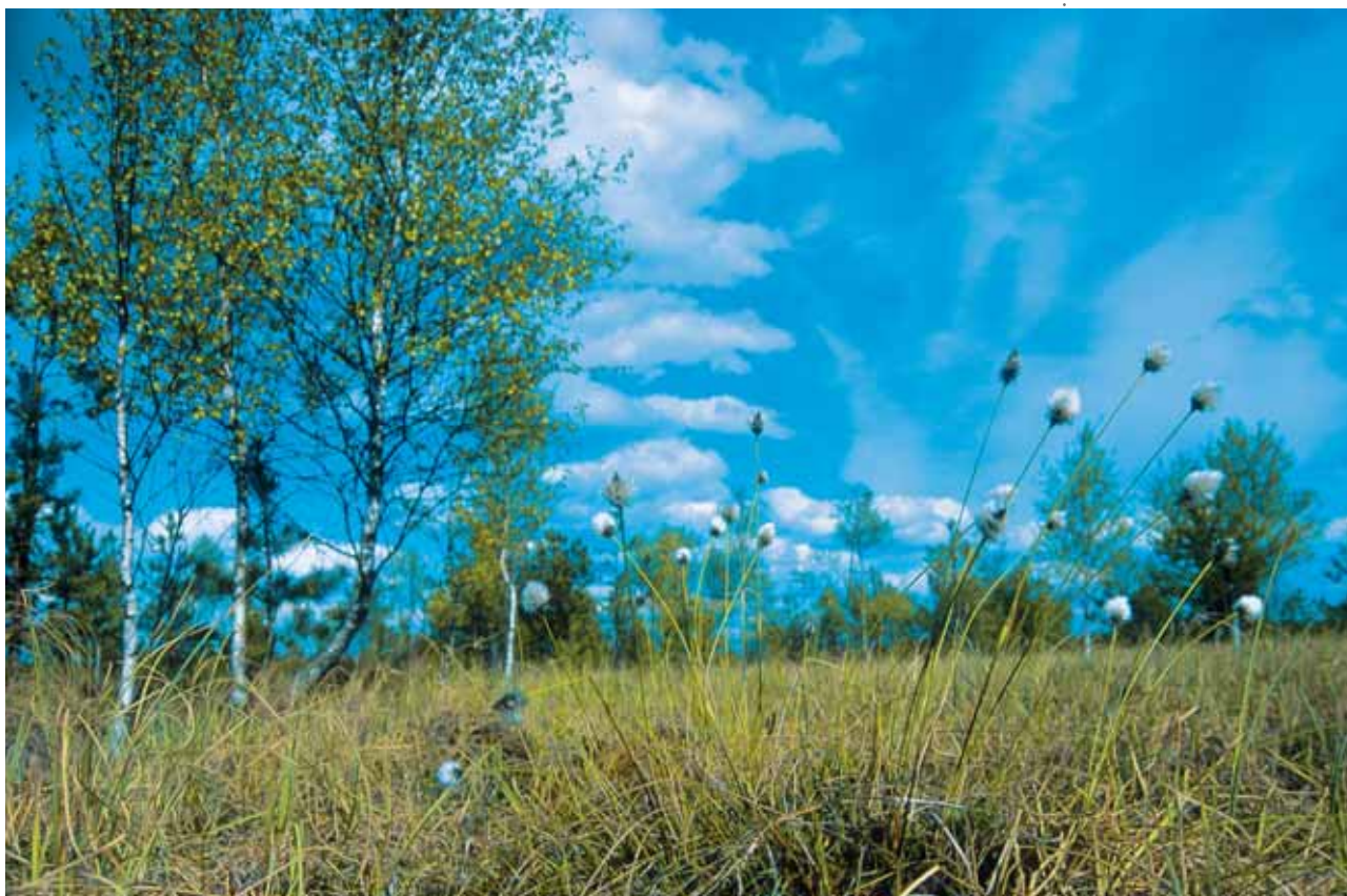
Torfowisko nad jeziorem Moszne

Ośrodek Dydaktyczno-Muzealny PPN znajduje się w Załuczu Starym . Jest to ważny obiekt edukacyjny, składający się z muzeum, wiaty muzealnej, ścieżki „Żółwik” z oczkiem wodnym, oraz Ośrodka Rehabilitacji Zwierząt z wolierą i wybiegiem dla ssaków.