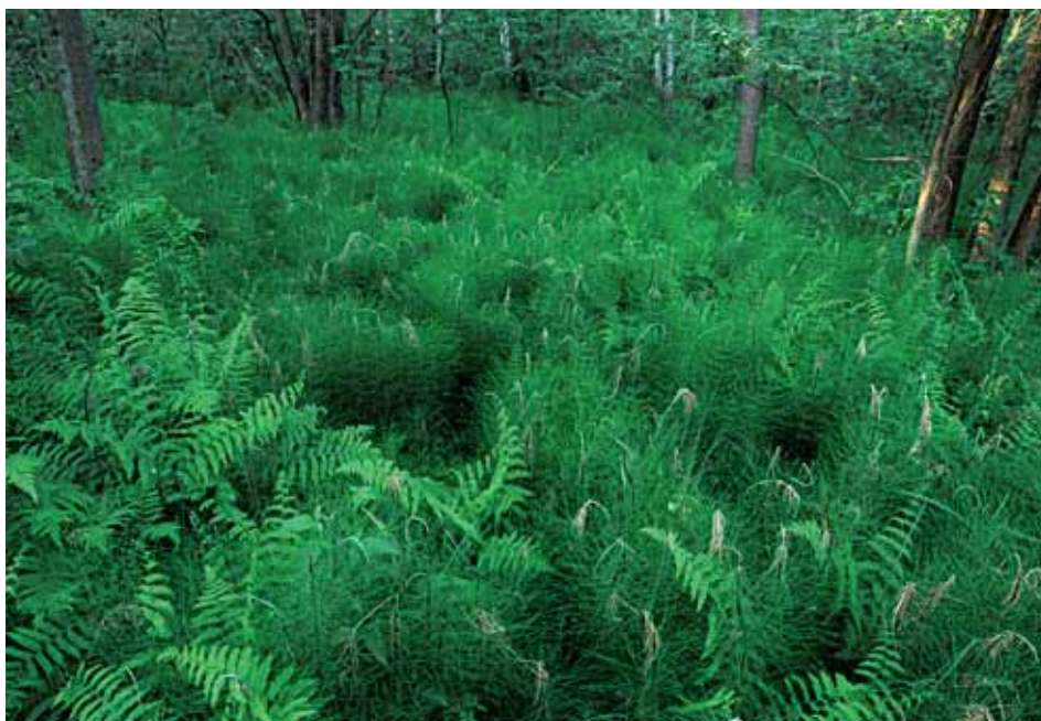
Skrzypy i paprocie porastające dno bagiennego lasu

Ośrodek Dydaktyczno-Administracyjny PPN znajduje się w Urszulinie i pełni ważną funkcję edukacyjną. Od września do maja goście mają okazję obejrzeć małe żółwie błotne w Ośrodku Ochrony Żółwia Błotnego . Poza tym w specjalnie przygotowanej sali projekcyjnej zwiedzający mogą zobaczyć filmy poświęcone przyrodzie parku i kulturze Polesia. Przy ośrodku urządzono także niewielki ogród dydaktyczny, zaprojektowany w taki sposób, aby prezentował namiastkę niektórych siedlisk charak-