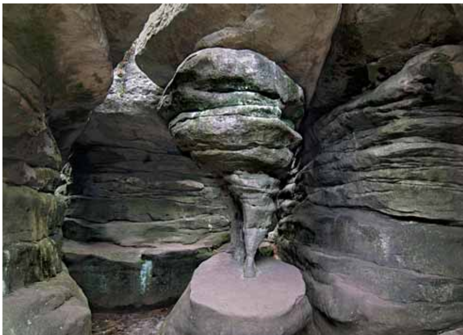
OOŚ „Błędne Skaly”

ny mikroklimat, charakteryzujący się niską temperaturą i dużą wilgotnością powietrza. Na dnie Piekiełka śnieg zalega zwykle do połowy czerwca. Na Szczelińcu znajduje się schronisko PTTK.